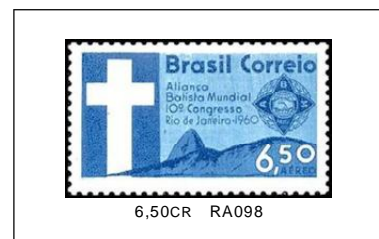
Alianza Baptista (Aéreo) 01/07/1960