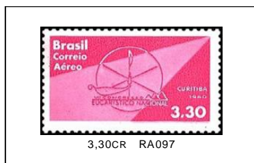
Congreso Eucarístico (Aéreo) 16/06/1960