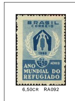
Refugiados (Aéreo) 07/04/1960