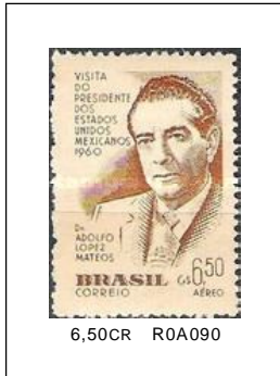
Presidente Mateos (Aéreo) 19/01/1960