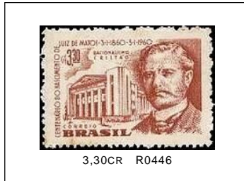
Luiz de Matos 03/01/1960