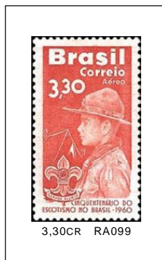
Scouts (Aéreo) 23/07/1960