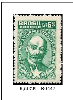
L. L. Zamenhof 10/03/1960