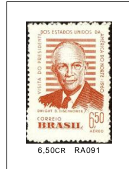
Eisenhower (Aéreo) 23/02/1960